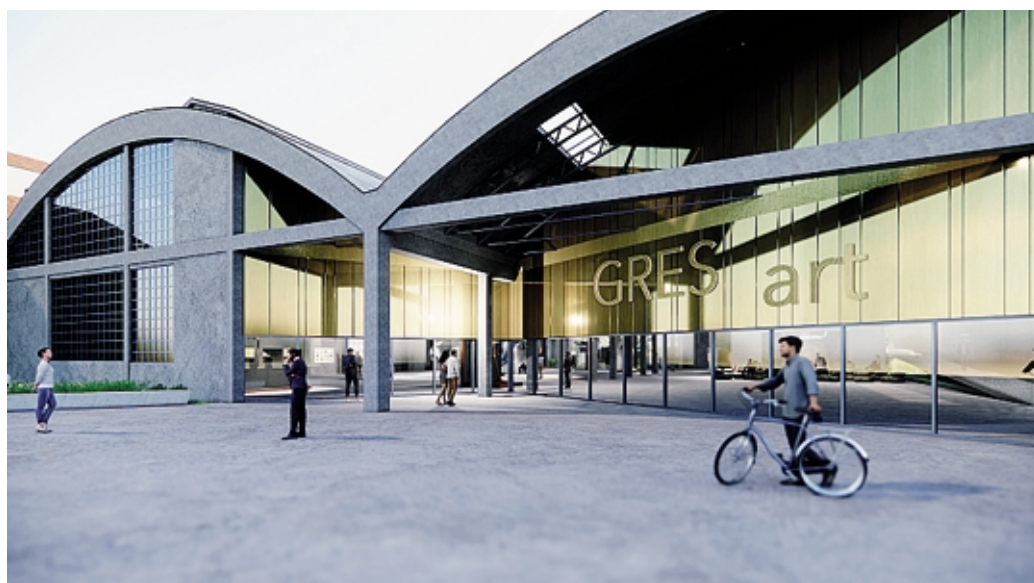
Gres Art: il padiglione ospiterà opere d'arte, eventi e convegni. Il progetto dello studio De8_Architetti