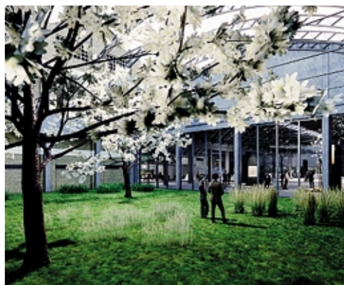
È previsto anche un giardino di 600 metri quadri